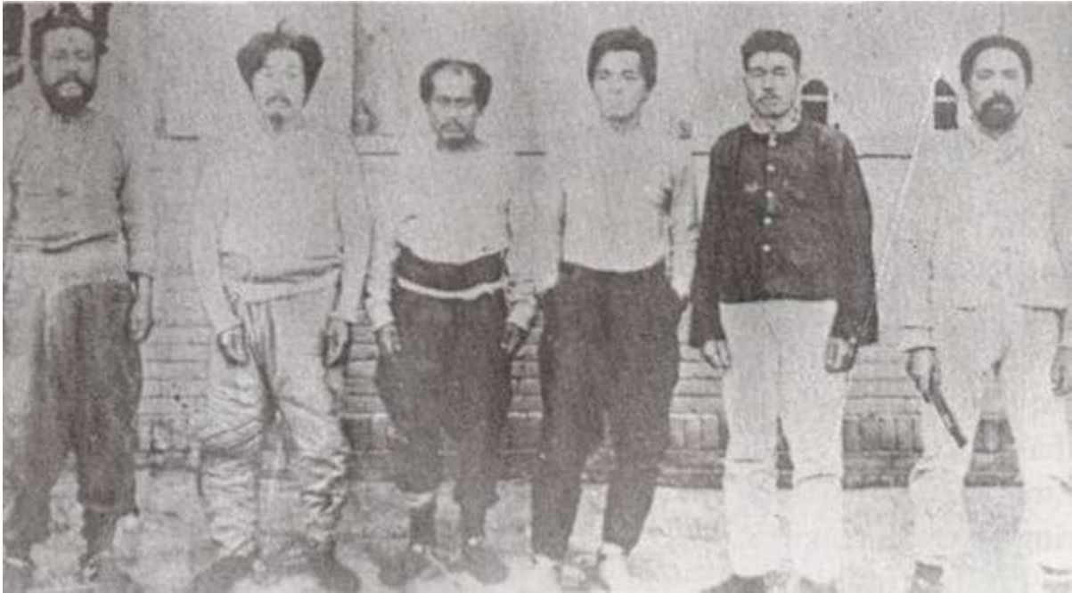
Fotografia urobená tesne pred plánovanou popravou. Onisaburo Deguchi je druhý, Morihei tretí zľava. (Budo, str. 12)