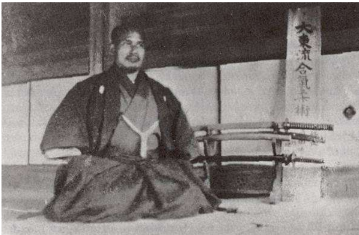
Morihei pred svojím prvým dojo "Ueshiba yuku" v Ayabe vo veku 38 rokov

V roku 1922 navštívil Moriheia jeho učiteľ Sokaku Takeda, ktorý pricestoval s celou rodinou a zdržal sa bezmála šesť mesiacov. Onisaburo si výstredného a podozrievavého Takedu neoblúbil a Morihei bol po celú dobu v ťažkej pozícii medzi svojimi dvoma učiteľmi. Aj napriek tomu, že Takeda svojou náturou do komunity veriacich sotva zapadal, mnoho ich v Ueshibovom dome učil a na konci svojho pobytu vydal Moriheovi formálne učiteľské osvedčenie.