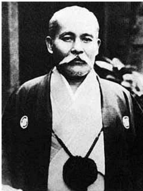
Morihei v 40. rokoch 20. stor.

Časť tohto obdobia vyučoval Ueshiba techniky Daito-ryu aikijujutsu, ako sa niekedy nazýva Takedovo umenie, a udelil „certifikáty“ (tzv. "odovzdávajúci zvitok" na sebe niesol zoznam všetkých techník, ktoré študent zvládol) s menom tejto školy. Moriheiov vzťah s Takedom však v dôsledku jeho finančných požiadaviek postupne ochladol, a tak sa od svojho bývalého učiteľa postupom času dištancoval. Po roku 1935 spolu neboli viac v kontakte, no aj napriek tomu techniky Daito-ryu v modifikovanej forme stále tvorili väčšinu Ueshibovho repertoáru. Pred 2. svetovou vojnou sa pre jeho umenie najčastejšie používal názov „aiki budo“. Počas celej tej doby Ueshiba udržiaval úzky vzťah s náboženstvom Omoto a Onisaburom. Pre šírenie Moriheiovho bojového umenia bola na Onisaburov podnet založená „Spoločnosť pre propagáciu bojových umení“, nad ktorou držalo Omoto záštitu. Po celom Japonsku boli založené pobočky, kde prebiehali tréningy – obvykle spoločne s pobočkami Omoto. Organizácia bola činná v rokoch 1931 až 1935, kedy bolo Omoto brutálne potlačené japonskou vojenskou vládou.