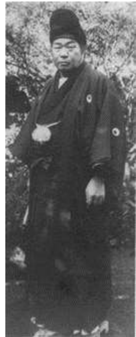
Onisaburo Deguchi okolo roku 1920

Na dlhej ceste späť do Tanabe sa pustil Morihei do rozhovoru so spolucestujúcim, ktorý zanietene hovoril o liečiteľských schopnostiach mimoriadneho človeka, náboženského vodcu menom Onisaburo Deguchi . Keďže túžil sa s ním stretnúť a požiadať ho, aby sa modlil za otcovo uzdravenie, zmenil pre tú chvíľu Morihei cieľ svojej cesty. Odbočil do mesta Ayabe, centra náboženstva Omoto , ktoré leží neďaleko Kjóta. Charizmatický Onisaburo zanechal v Moriheiovi trvalý dojem, a tak zostal v Ayabe niekoľko dní.