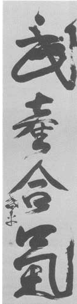
Morihei raz povedal: "Takemusu Aiki ti povie, či je tvoja technika mŕtva alebo živá." Na obrázku Takemusu Aiki, (podpísaný) Morihei. (The Essence of Aikido, str. 84)

V tejto fáze života v Iwame zakladateľ formuloval tiež koncept takemusu aiki – spontánneho prevedenia nekonečného množstva technik spôsobom úplne zodpovedajúcim špecifickým podmienkam.